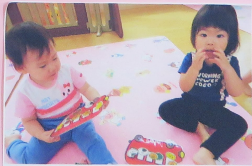
「何から食べちゃあかな?」「遠足に楽しい～」