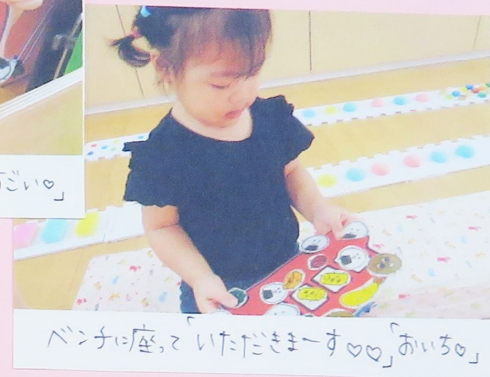
ベンチに座って、いたたまきまーす♡「あいろ」

ゆき、つき、ほしくみさんは遠足に出発多 つばみくみのみんなもお部屋の中で遠足気分を 味わいました。😊「おべんとうバス」の絵本が大好きな 子ども達。1人1人自分のバスとおいにぎり、ハンバーグ たまごせき... 絵本にも登場する具材をもらい、「うん どれがいいかな?」と悩みながらもオリジナルバスが完成多