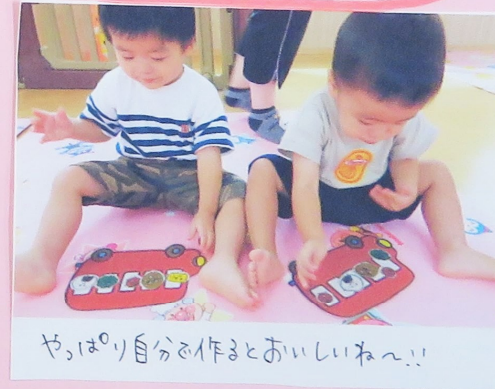
やっぱり自分を作るとおいしいね～!!