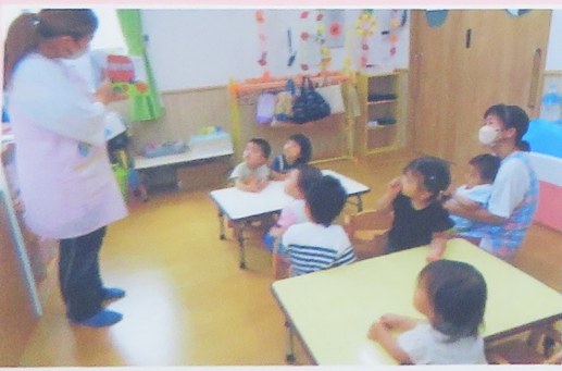
イスに座って、おべんとうバスの絵本をみたよ多