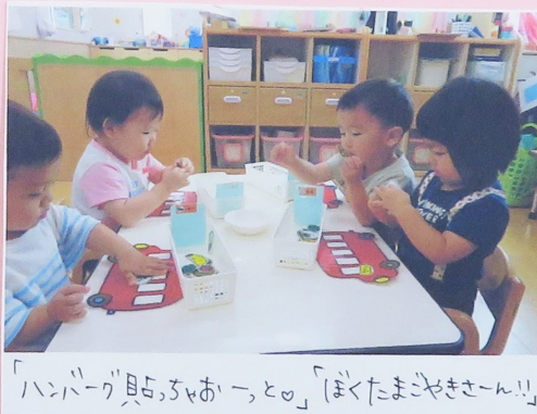
「ハンバーグ見て、ちあーと♡」「ほくたまごせきせん!!」

ゆき、つき、ほしくみさんは遠足に出発多 つばみくみのみんなもお部屋の中で遠足気分を 味わいました。😊「おべんとうバス」の絵本が大好きな 子ども達。1人1人自分のバスとおいにぎり、ハンバーグ たまごせき... 絵本にも登場する具材をもらい、「うん どれがいいかな?」と悩みながらもオリジナルバスが完成多