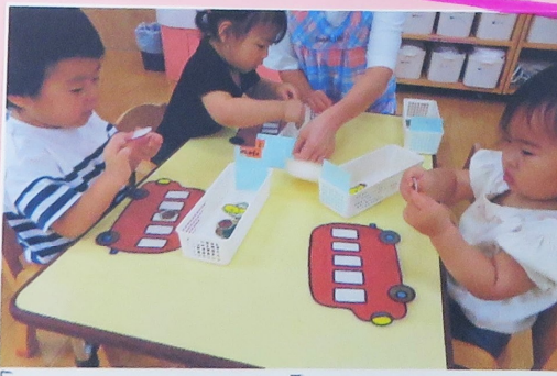
「うん、はがせるかな?」「なにを貼るのかな?」