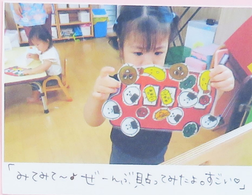
「みてみて～よせーんぶ、見てみてよ。すごい♡」